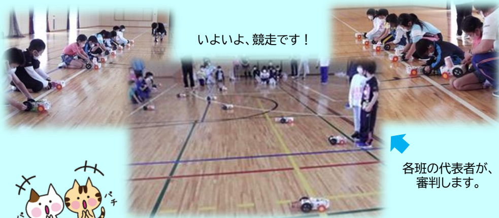
いよいよ、競走です！