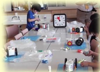
紙ゼンマイエコCARができました。 あとは、飾りつけです。