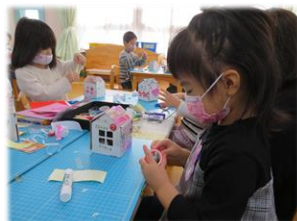
飾付けに夢中です！ かわいくしよう♪