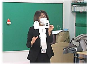
段ボールの線がついているところを折りましょう。